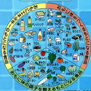
文部科学省 食生活学習教材より